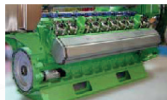
Top Start 4 à 9 kW